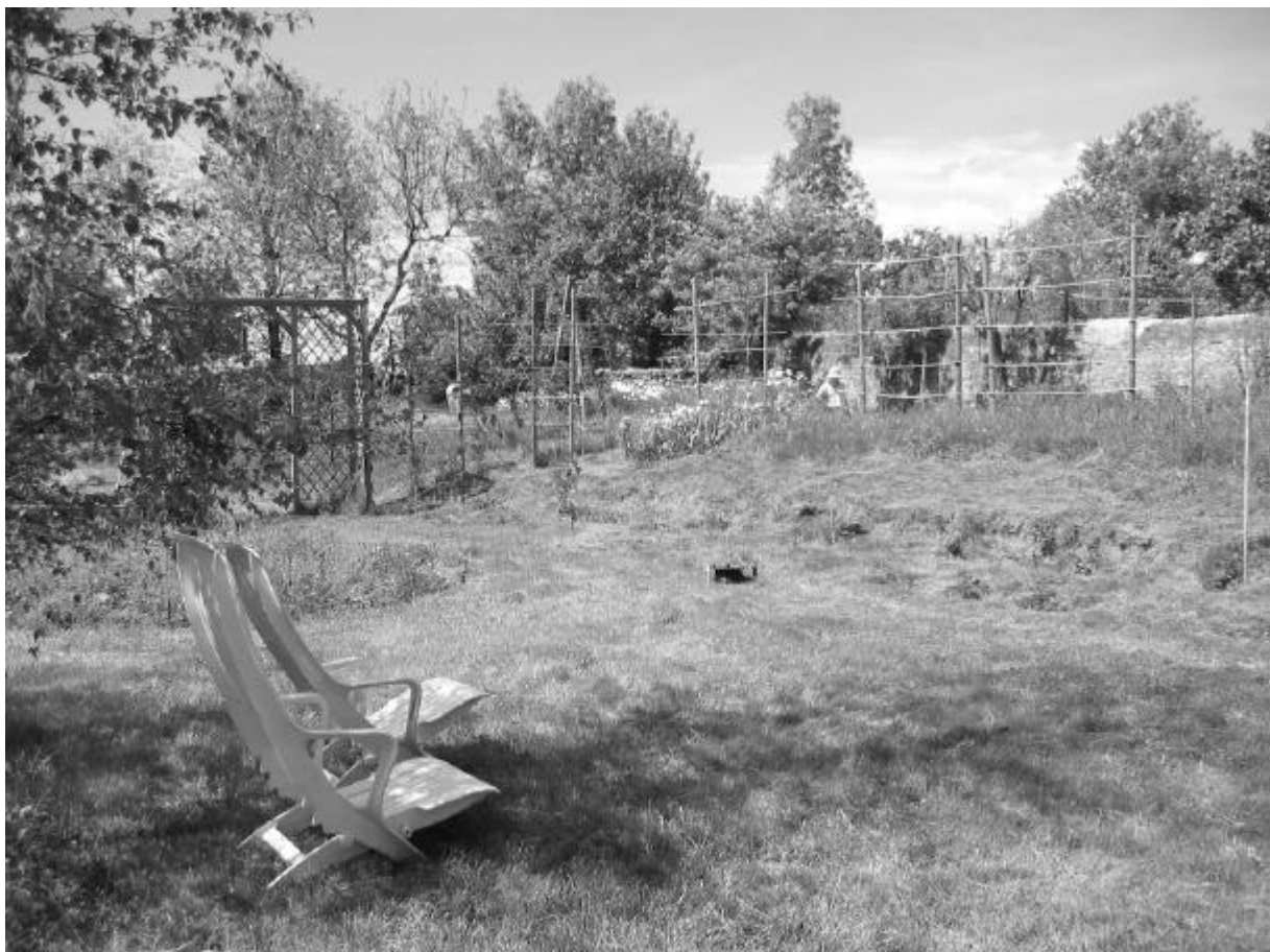
Le coin de la brodeuse...

Vermersch P. (2002b) L'attention entre phénoménologie et sciences expérimentales, éléments de rapprochement. Explicititer . 14-43.